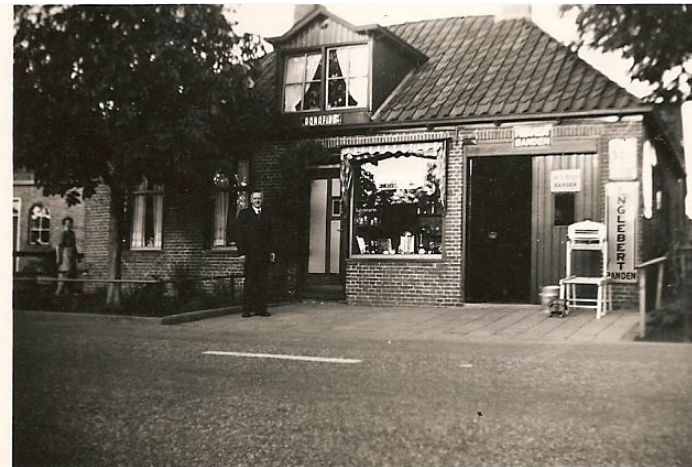
Uit het archief van de Historische Vereniging: hier een foto van het huis Rijksweg 40 in Ten Post.