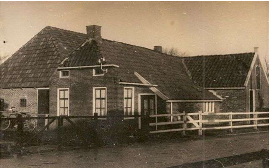
Wie weet waar dit huis staat of heeft gestaan?

*_*_*_*_*_*_*_*_*_*_*_*_*_*_*_*_*_*_*_*_*_**