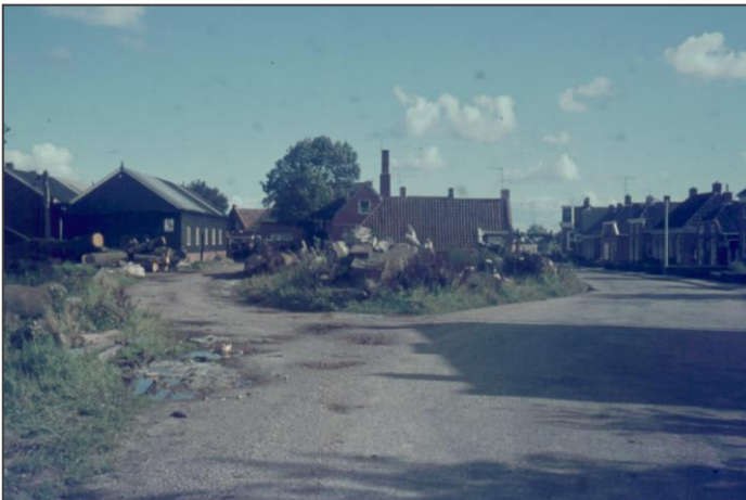
Meulnheim vanaf de andere kant bekeken.

*_*_*_*_*_*_*_*_*_*_*_*_*_*_*_*_*_*_*_*_*_*_*_*