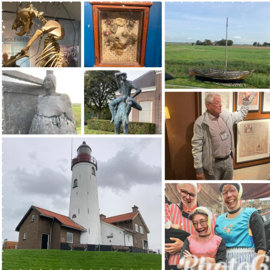
Een impressie van de TAC reis